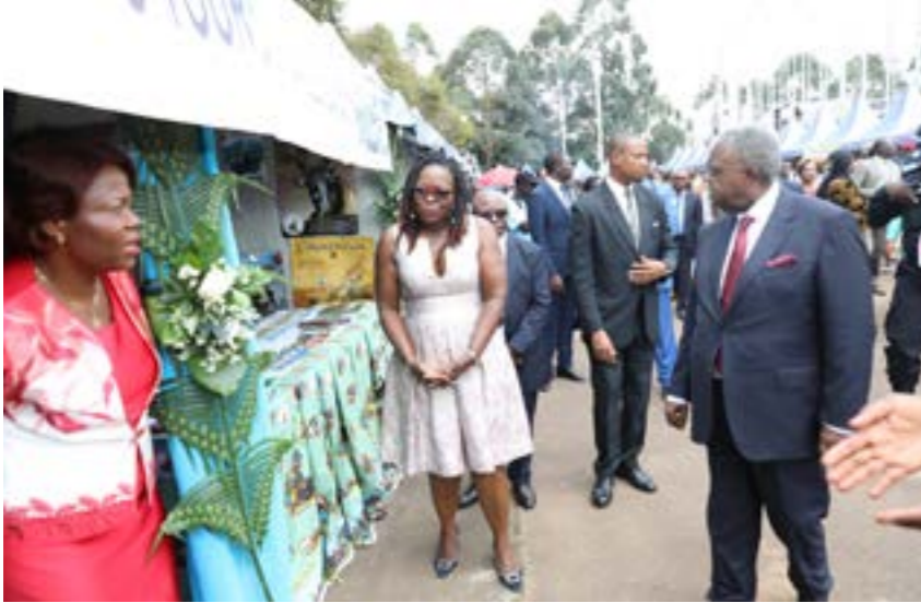
Le Ministre de la Communication visite les stands d'exposition