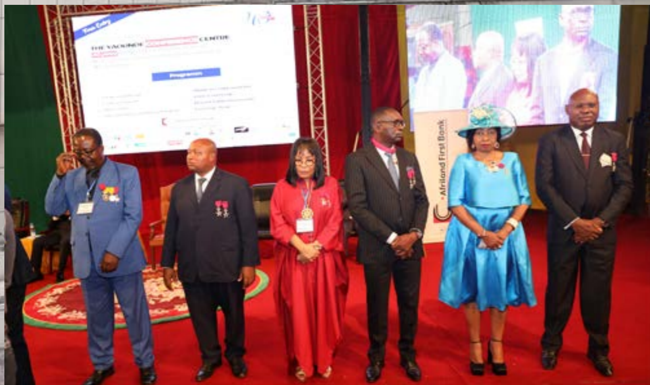
Les médaillés du jour.