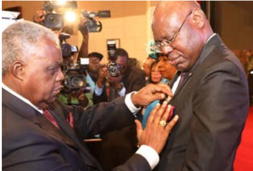
Remise de la médaille au DG du Palais des Congrès par le Ministre R. E. SADI