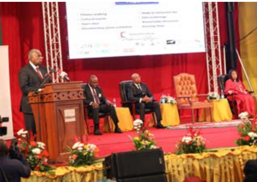
Officiels et public au Rendez-vous